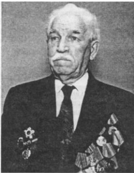
ка. – Кам'янка, 2008. – С. 1.