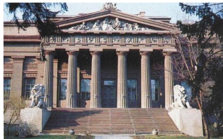
Національний художній музей

детальної розробки своєї ідеї. Справу доручили В. Городецькому (до речі, члену Київського товариства старовини й мистецтв), якій у лютому 1898 р. завершив та підписав ретельно розроблений комплект креслень фасадів, планів і розрізів будинку. Схожа на античний храм, з композицією "Торжество мистецтва" на фронтоні та гігантськими левами на бокових виступах сходів, будівля музею і сьогодні вражає майстерною стилізацією античної класики.