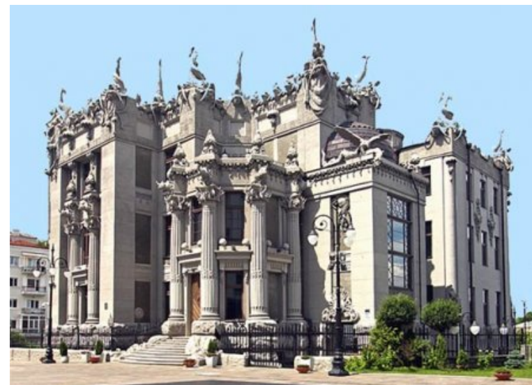
"Будинок з химерами"

Розташована на крутому схилі, будівля має три поверхи з вулиці та шість – з двору. Зовні й усередині – безліч скульптурних прикрас, які виконав з цементу незмінний Е. Сала. Фасади – справжній кам'яний бестіарій: екзотичні тварини, птахи, земноводні сплелися в примарний орнамент, залишаючи враження химерного скам'янілого світу. Оздоблення інтер'єрів з численними трофеями підкреслює ідею "мисливського замку" або "мрії мисливця", втіленої у розписах та рельєфах.